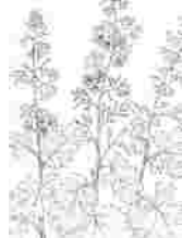
作品例 タケニグサ