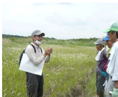
作業地がこのようなチガヤの原っぱになるか

②見沼たんぼ見どころガイドのパンフレット(市民レポーターのおすすめスポット)が さいたま市より発行されました。(無料です)私もレポーターとして記事を書きました。