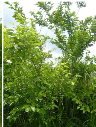
小道を挟んだエリアを草刈、画面の右側には桑の木が密集していて、これらも伐採する ↑ 桑の木