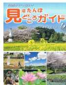
(市民レポーターのおすすめスポット)