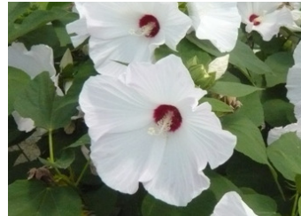
一重の芙蓉：真夏の光を浴びて涼やかなチヂミの花びらが紅色に、真っ白に輝いていました