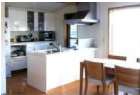
システムキッチンを採用しセミオープン式のキッチン