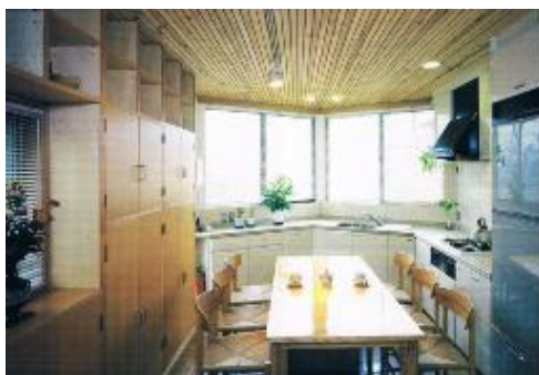
変形のダイニングキッチン