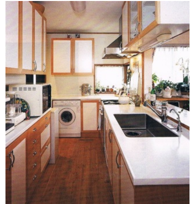
キッチンで料理をしながらリビングが見渡せる