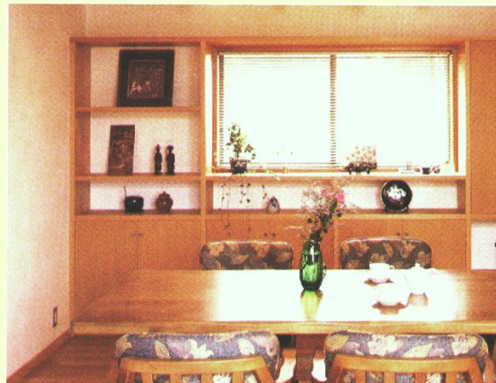
窓を中心に飾り棚をレイアウト