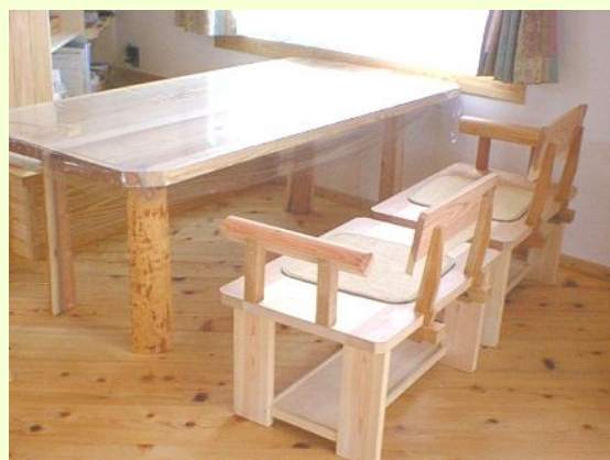
この2本の椅子を合わせるとベンチにもなる。 食卓、椅子は、杉の無垢板で加工する。