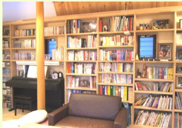
リビングで本を読んだりピアノを弾いたり