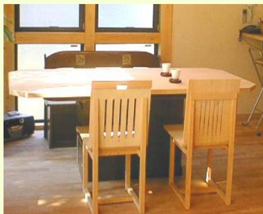
手持ちの食卓の台を利用して天板を新たに作る。 手前の椅子は、厚ベニヤを加工。足は檜。