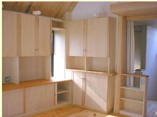
書籍や小物を入れる収納棚。収納重視