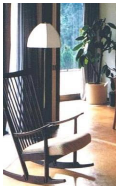
ロッキングチェア用のフロアースタンドをデザインし照明器具店に製作を依頼。シェードは布製、スタンドの足にキャスターを付け移動し易いようにしました。