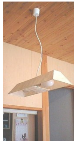
私がデザインし、和紙作家に製作してもらいました。