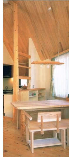
食卓上の照明に、杉板を基盤にしシンプルなブラケットを3個配列。