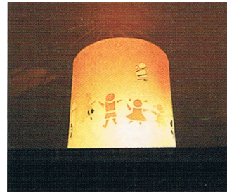
ワーロン紙を筒状にし、カゴメカゴメの模様を切り抜きました。