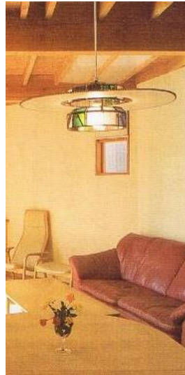
ガラス作家がスタンドグラスをランプの周りにはめ込んで製作、その光が壁に映り美しい。