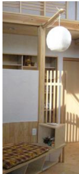
照明の位置を左右に回転できるペンダント。器具がリクリント。