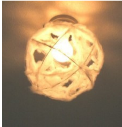
針金に綿を巻きつけ雪玉を表現。