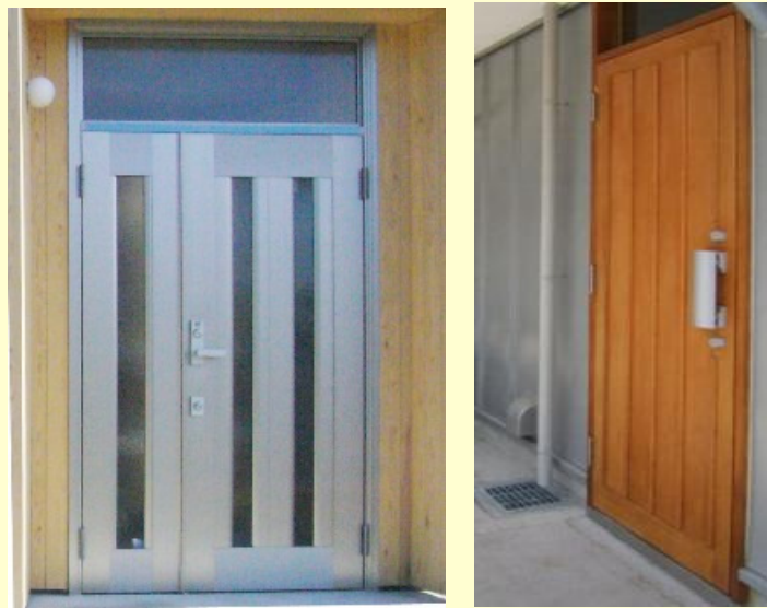
左：既成のアルミ製ドアとレバーハンドル付錠前

把手・レバーハンドル・玄関錠・ガードチェーン・ガードアーム・戸当り・ドアストッパー・ドアクローザー・丁番・ヒンジなどがあります。最近の玄関錠は電気錠などの様々な機種が開発されています。