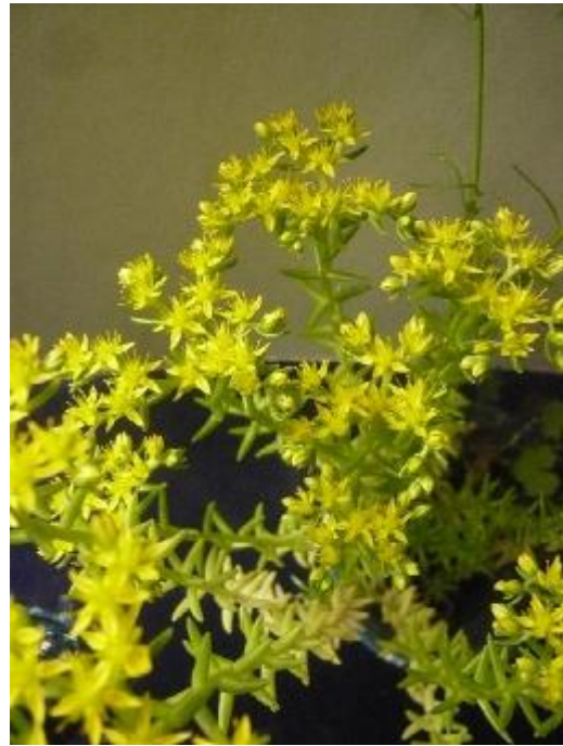
小さな花が一斉に咲きました