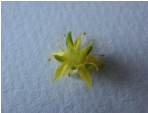
経 8 ミリの大きさの花を真上から