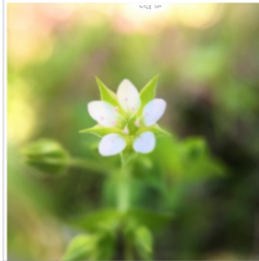
一見ハコベ?、花びらの先端が割れてる