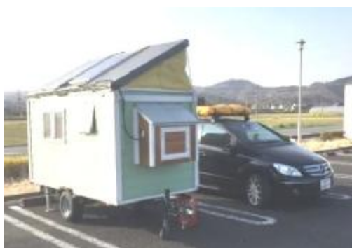
トレーラーハウス