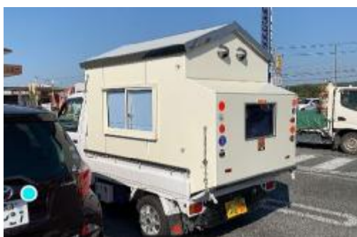
室内の換気用フード？