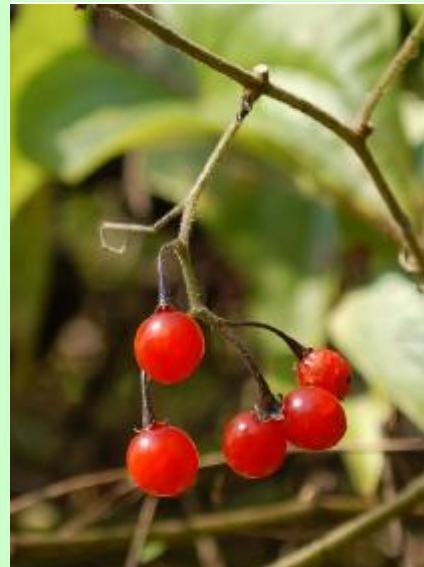
ヒヨドリジョウゴ