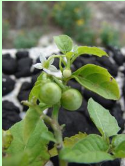
アメリカイヌホオズキ