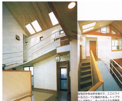
住宅の中央は吹き抜けで、ここにワイ ドなスロープと階段がある。トップラ イトで明るく、ホールのような空間だ。