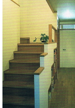
カげた階段、大黒柱を中心に 階段下を収納に