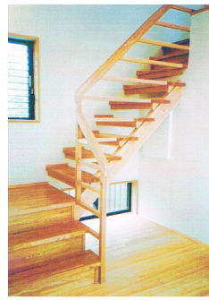
音り場の下は収納 階段下に風通し用地窓