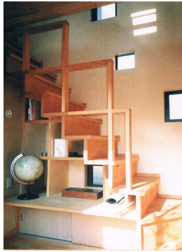
モンドリアン手摺